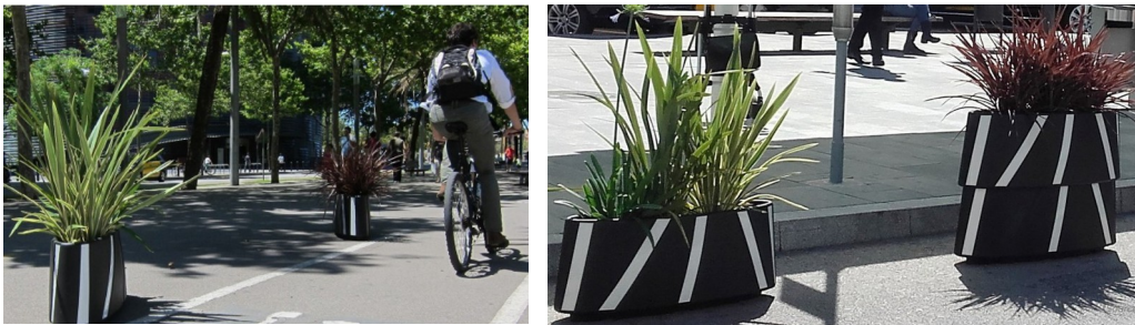
Jardinières paysagères déplaçables empilables, modèle Zebra de chez Zicla

Pour davantage de précision sur l'aire piétonne temporaire, voir également :