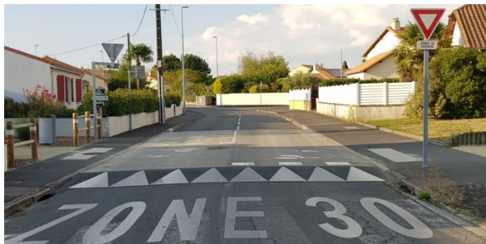
Rue de la Grand Pièce – Saint-Sébastien-sur-Loire

Dans cette configuration, un plateau en enrobé grenailé rappelle que la vitesse passe à 30 km/h et alerte en plus de la signalisation sur le passage prioritaire de la voie verte perpendiculaire.