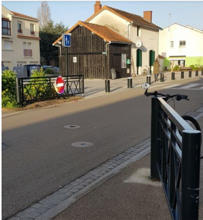
Barrière ouverte, hors marché