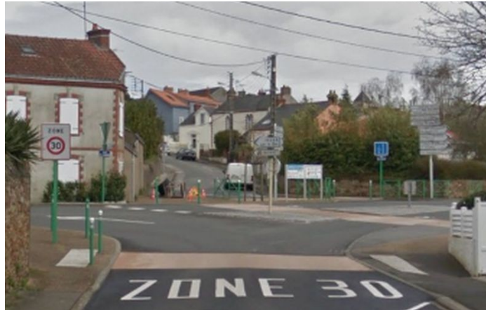
Rue de la courante – La Montagne

Ici, l'entrée de la zone 30 est marquée par un passage piéton avec un revêtement différent , rappelant celui utilisé pour les piétons. Les dalles podotactiles sont conservées pour faciliter la compréhension des usagers.