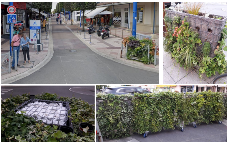
Fermeture par des jardinières pendant les horaires de marché – Andernos Les Bains

Fermeture de la zone de rencontre par des jardinières sur roulette pour une aire piétonne temporaire les jours de marché.