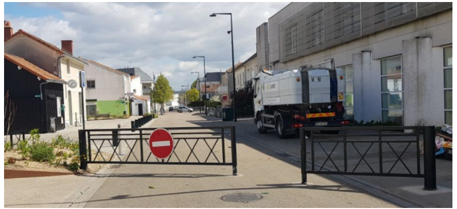
Barrière fermée – Fin de marché : les balayuses s'activent