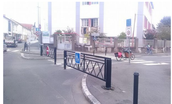
Fermeture des barrières pendant les horaires d'entrées et de sorties de l'école - Nantes

Ces rues en Zone 30, sont traitées est transformées temporairement en aire piétonne lors des marchés, ainsi qu'aux horaires d'entrées et de sorties des élèves. Pour cela, la barrière mise en place est constituée de 2 vantaux refermables manuellement et accompagnée d'une signalisation adéquate.