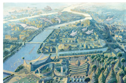
© 2022 Cité Végétale - Luc Schuiten