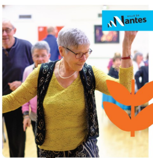
Bien vieillir Le programme mensuel Juillet 2023 DÉCOUVREZ TOUTES LES ACTIVITÉS POUR LES NANTAISES ET LES NANTAIS DE PLUS DE 65 ANS

• Des animations dans le cadre du dispositif « Bien Vieillir » : la Ville de Nantes propose à tous les Nantaises et Nantais de plus de 65 ans, un programme d'activités dans ses différents établissements (restaurant intergénérationnel Malville, résidences autonomie, EHPAD) et dans plusieurs quartiers de la ville. Au programme par exemple : gym douce, loto, karaoké, atelier chorale, etc.