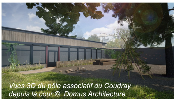
Vues 3D du pôle associatif du Coudray depuis la cour © Domus Architecture

Pour la Ville de Nantes, répondre aux besoins et attentes des habitantes et habitants de ses quartiers par des services en proximité est une priorité. Cette année 2024 marque le début des travaux du futur pôle associatif du Coudray, restructuré et agrandi (près de 300 m 2 supplémentaires). Il rouvrira ses portes à l'horizon 2025 dans les locaux de l'ancienne école maternelle au 2 rue Pierre Benoît, dans le quartier Malakoff Saint-Donatien. Ce nouvel espace générateur de liens dans le quartier, lieu essentiel pour la vie sociale et culturelle, est très attendu