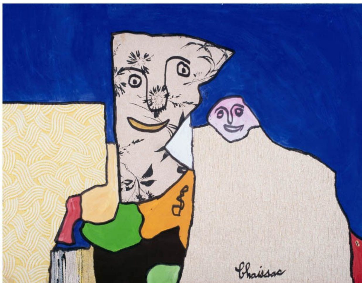
Deux personnages, 1963

À la manière de Chaissac, créez un personnage à partir de papiers déchirés !